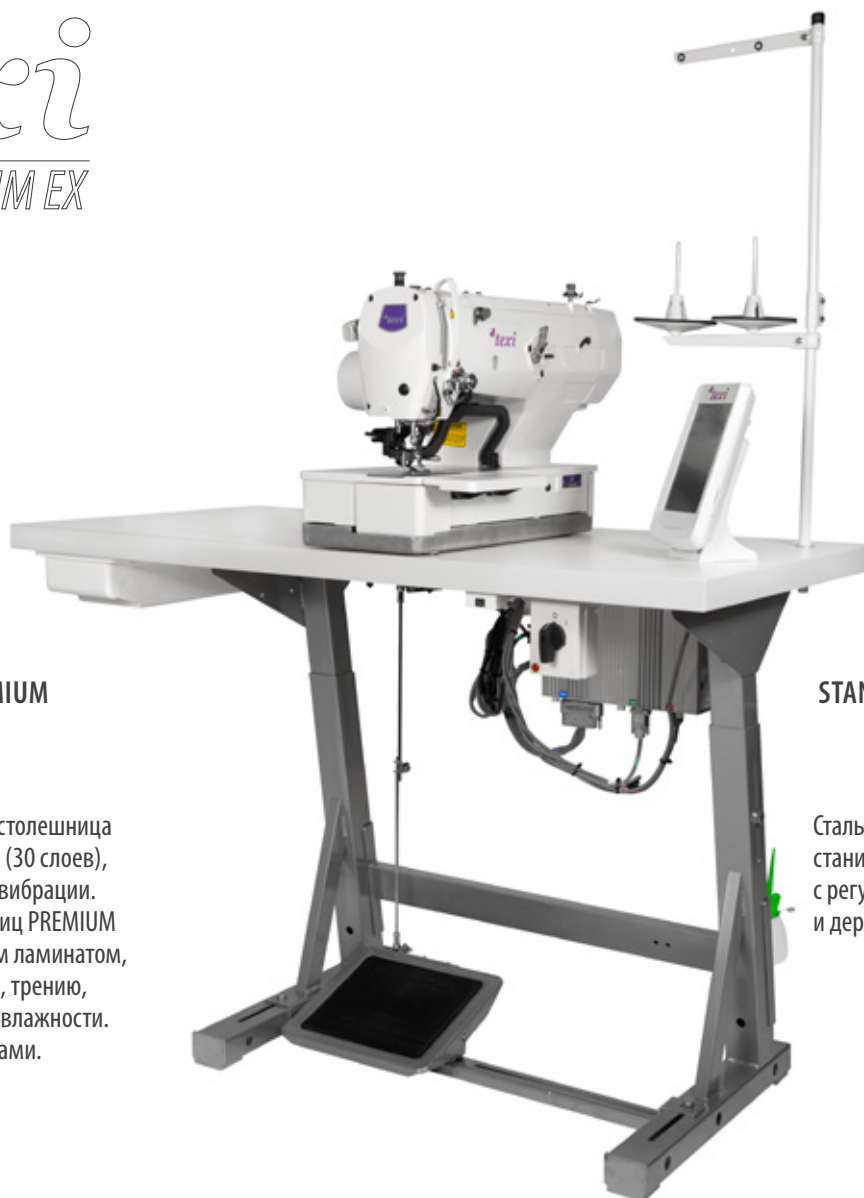
TABLE TOP TO PREMIUM

Высококачественная столешница из березовой склейки (30 слоев), прекрасно ослабляет вибрации. Поверхность столешниц PREMIUM покрыта специальным ламинатом, устойчивым к ударам, трению, воздействию масла и влажности. Бока защищены рейками.