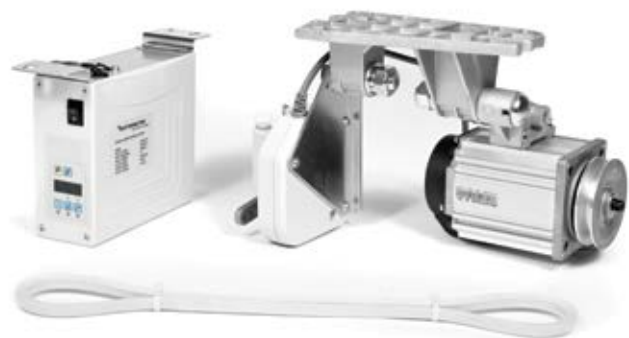
TEXI POWER 750 S